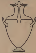
15. Hydrie .